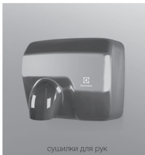
сушилки для рук