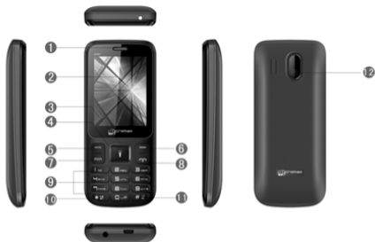
Рис.1. Устройство телефона