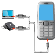
Рис.4. Зарядка аккумулятора