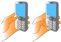
Рис.6. Блокировка (разблокировка) клавиатуры