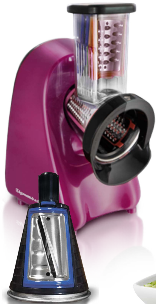
Каркас для насадок