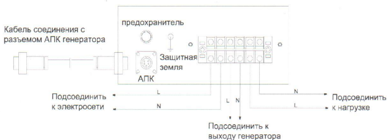
Рисунок 1. Схема подключения.