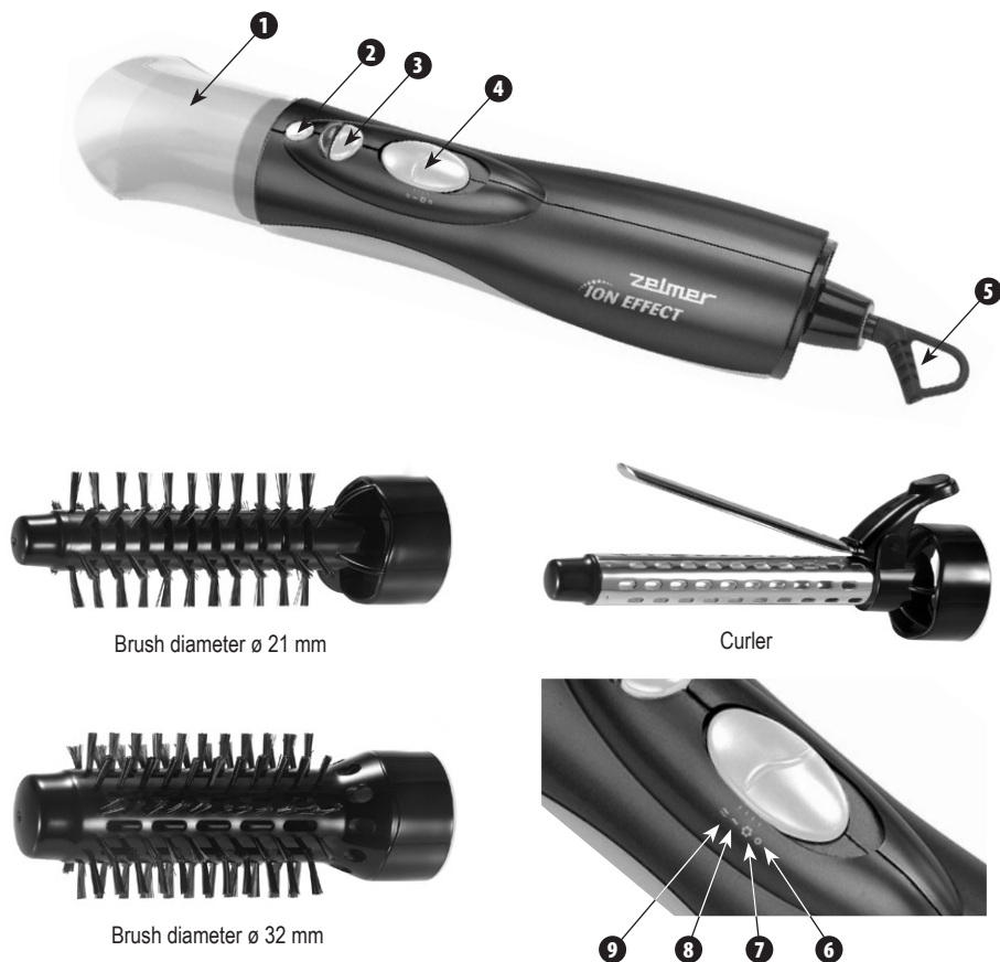
Brush diameter \varnothing 21 mm