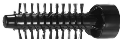
Ķemmes diametrs o 21 mm