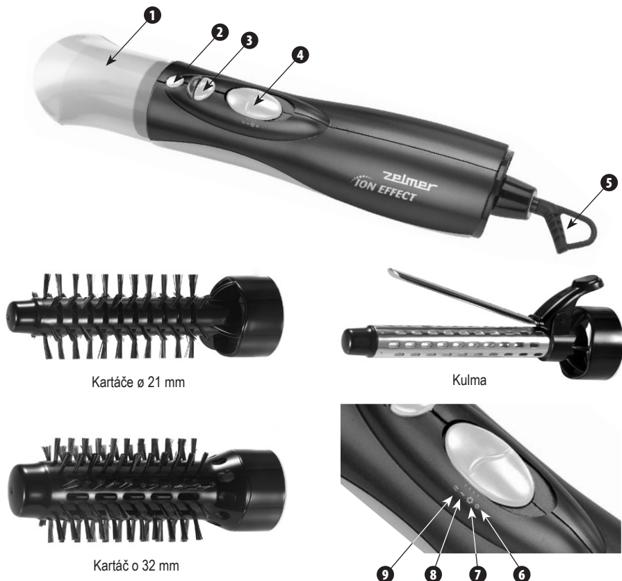
Kartáče ø 21 mm