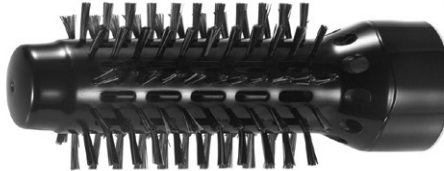
A kefe keresztmetszete \varnothing 32 mm