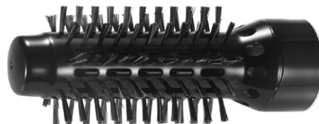
Perie cu diametrul de \varnothing 32 mm