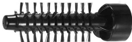
Perie cu diametrul de \varnothing 21 mm