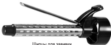
Щипцы для завивки