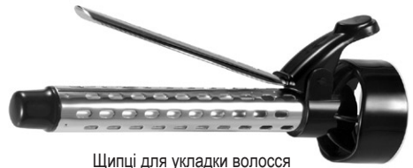
Щипці для укладки волосся