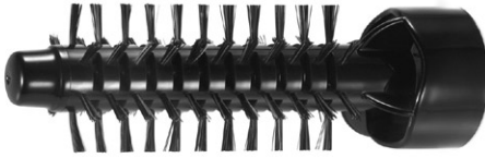
A kefe keresztmetszete \varnothing 21 mm