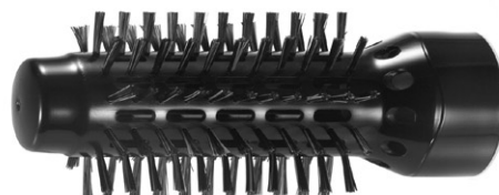
Диаметър на четката \varnothing 32 mm