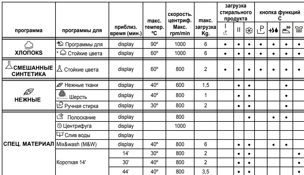
Таблица программ мод. CTD 10762

* Рекомендуемая программа для стирки теплой водой (температура ниже указанного максимума). Тестовая программа стирки на соответствие требованиям стандарта CENELEC EN 60456 с максимальной степенью загрязненности.