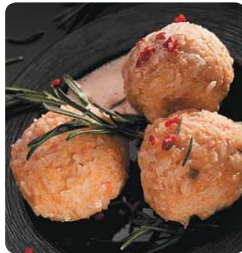
Рис отварить и остудить. Рыбу пропустить через мясорубку, добавить пассированный лук, яйцо и рис, измельченный розмарин, соль, перец. Сформовать круглые ежики и готовить их в пароварке BORK 30 минут.

300 г риса, 500 г рыбы, 1 яйцо, 1 луковица, веточка розмарина, соль, перец.