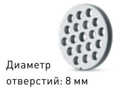
Диаметр отверстий: 8 мм