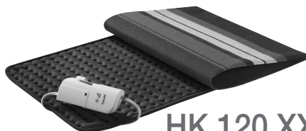
HK 120 XXL

(RUS) Электрическая грелка Инструкция по применению